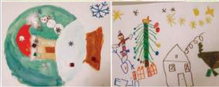
Les dessins des enfants