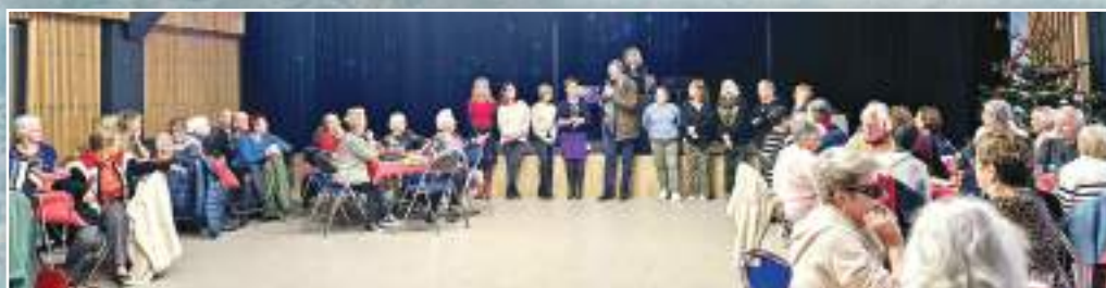
Le goûter des séniors