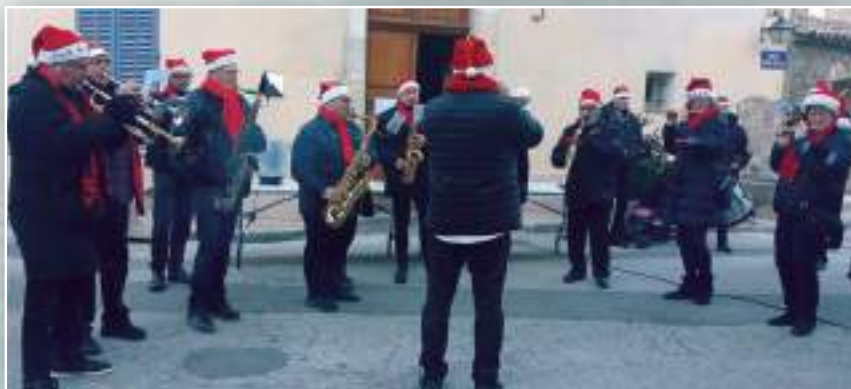
La fanfare de Tourves