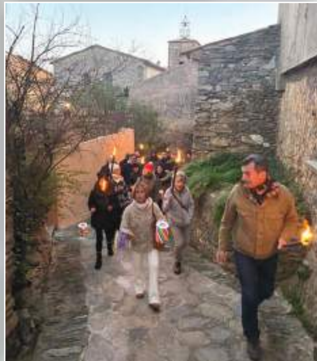
La montée aux flambeaux