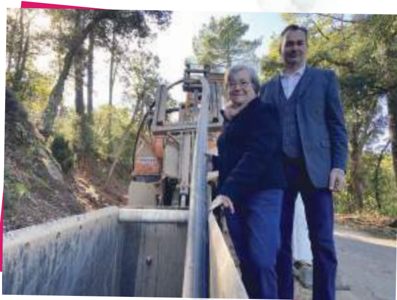
Mme la Vice-Présidente du pôle eau à la Communauté de communes