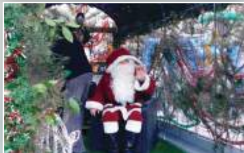
Le Père Noël dans son char