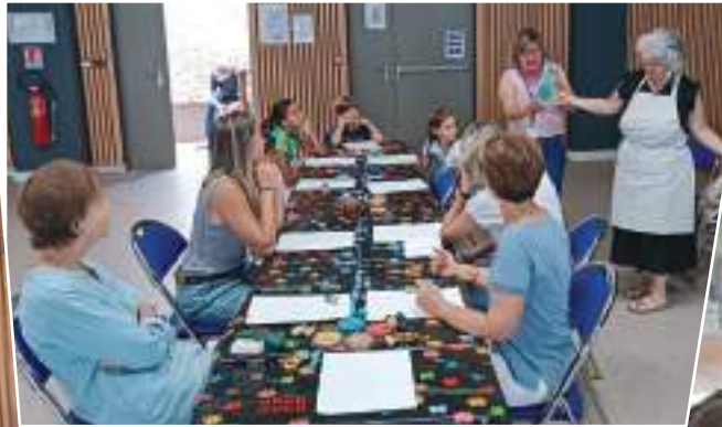
Atelier prix des lecteurs de Var animé par la Médiathèque Départemental du Var.