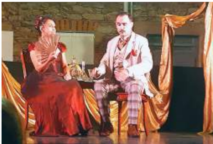
Duel au canif, une comédie de Maupassant, par la Compagnie Pleins Feux.