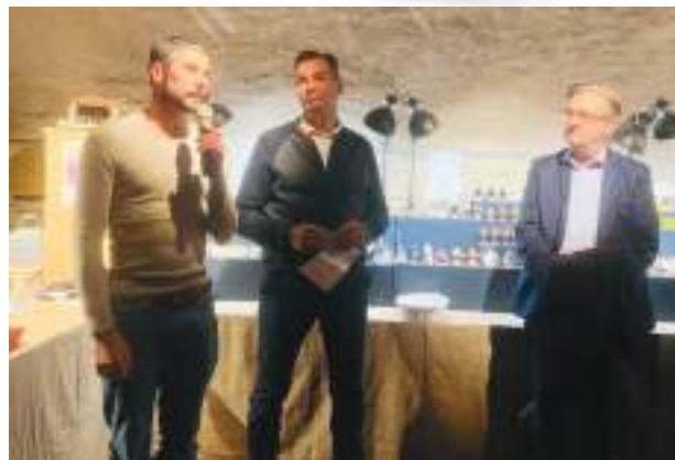
L'inauguration en présence de M.Philippe Lottiaux, député du Var.

Maxime Codou, avec l'aide des bénévoles de son association, a reconstitué dans la salle du rez de chaussée, le quartier de la Ponche et sa plage de la Pesquière tels qu'ils étaient au XIXème siècle. A l'étage, le monde agricole provençal est à l'honneur.