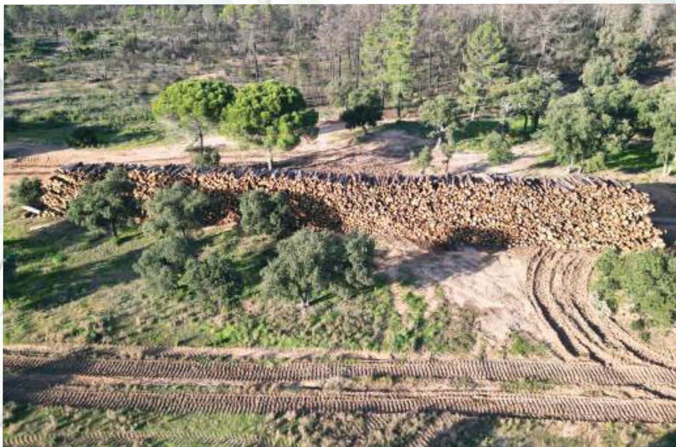
Quartier La Nible - Piste de la Nible

Dans le cadre du plan de gestion de sa forêt et avec l'Office National des Forêts, la commune pratique tous les ans d'importantes coupes de bois. Cette année nous en avons profité pour couper les bois brûlés suite au feu du 11 juin 2024.