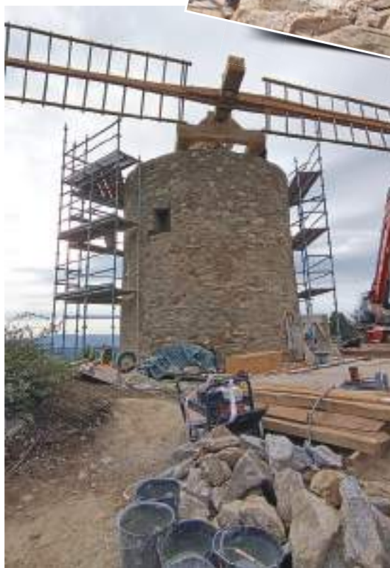
La pose des ailes