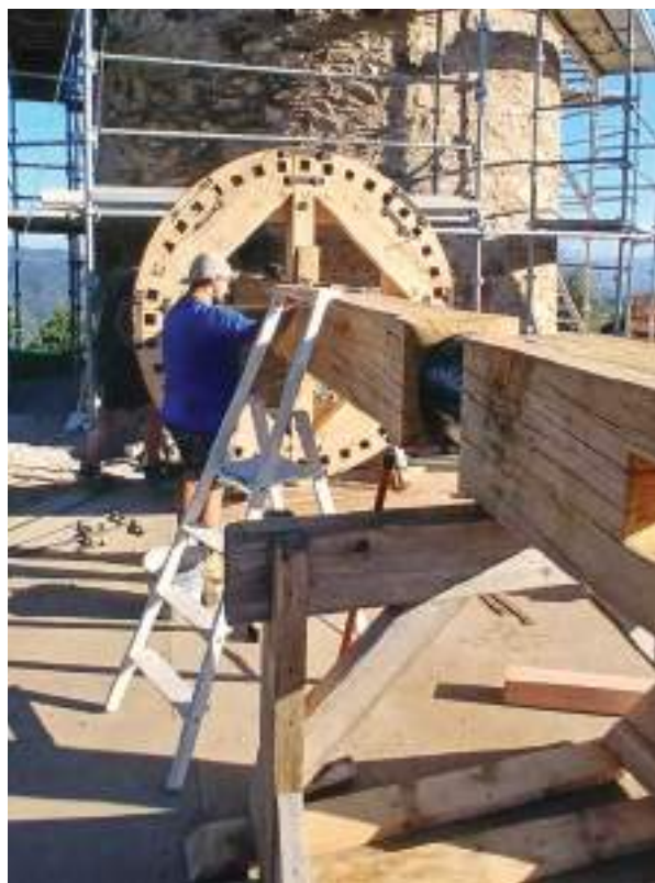
Les travaux débutés avant l'été ont été achevés en fin d'année