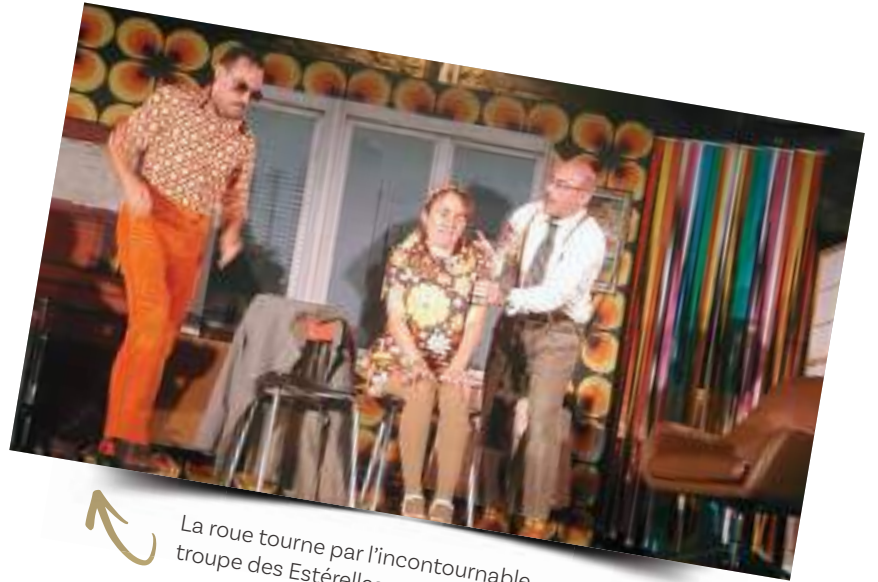
La roue tourne par l'incontournable troupe des Estérelles.