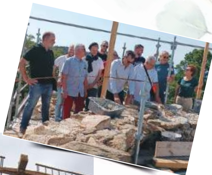
La pose de la 1ère pierre