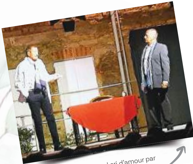
Un grand cri d'amour par l'Amphitryon théâtre.