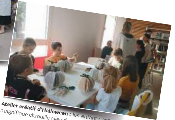
Atelier créatif d'Halloween : les enfants ont confectionné une magnifique citrouille avec de vieux livres.