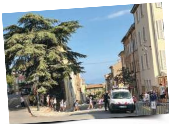
La rentrée à la bibliothèque

En outre, nous avons souhaité rénover ce bâtiment dans le cadre d'une démarche écoresponsable. Le choix des matériaux, l'installation de panneaux solaires, le chauffage au bois (granulés), la récupération des eaux de pluie, la désimperméabilisation d'une partie de la cour sont les axes principaux de cette rénovation. De plus, les matériaux issus de la démolition seront recyclés.