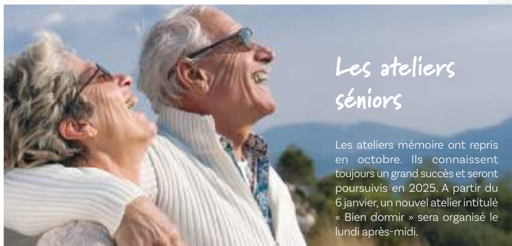
Les ateliers séniors

Les ateliers mémoire ont repris en octobre. Ils connaissent toujours un grand succès et seront poursuivis en 2025. A partir du 6 janvier, un nouvel atelier intitulé « Bien dormir » sera organisé le lundi après-midi.